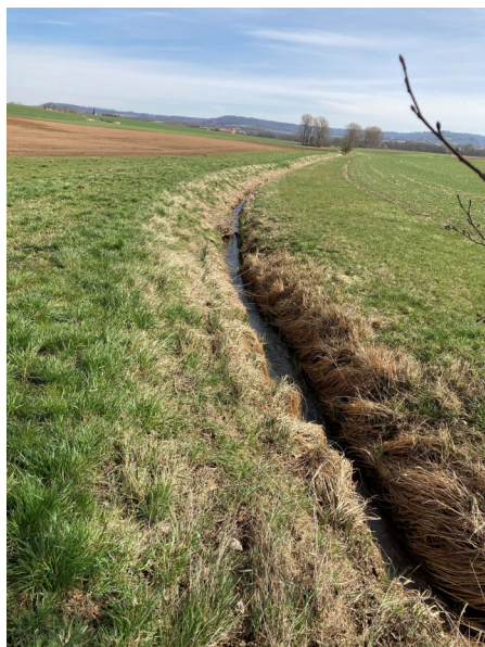
Abbildung 2: Randstreifenpflichtiges Kleingewässer bei Gepsattel