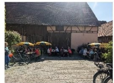
Café Kostbar Colmberg

Auf der letzten Etappe mit ca. 50 verbliebenen Radlern ging es zurück nach Colmberg ins Café „Kostbar“, zum gemütlichen Ausklang mit Kaffee und leckeren Torten.