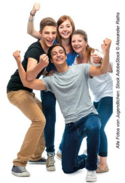
Alle Fotos von Jugendlichen: Stock-AdobeStock © Alexander Rahn