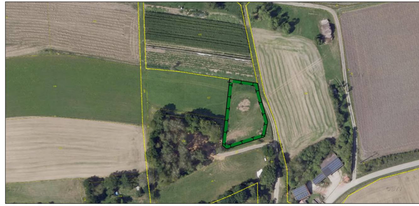
Luftbild, ohne Maßstab

Artenreiches Extensivgrünland auf einer Teilfläche der Flurnummer 102 der Gemarkung Geslau-Stettberg; Größe = 1.629 m²